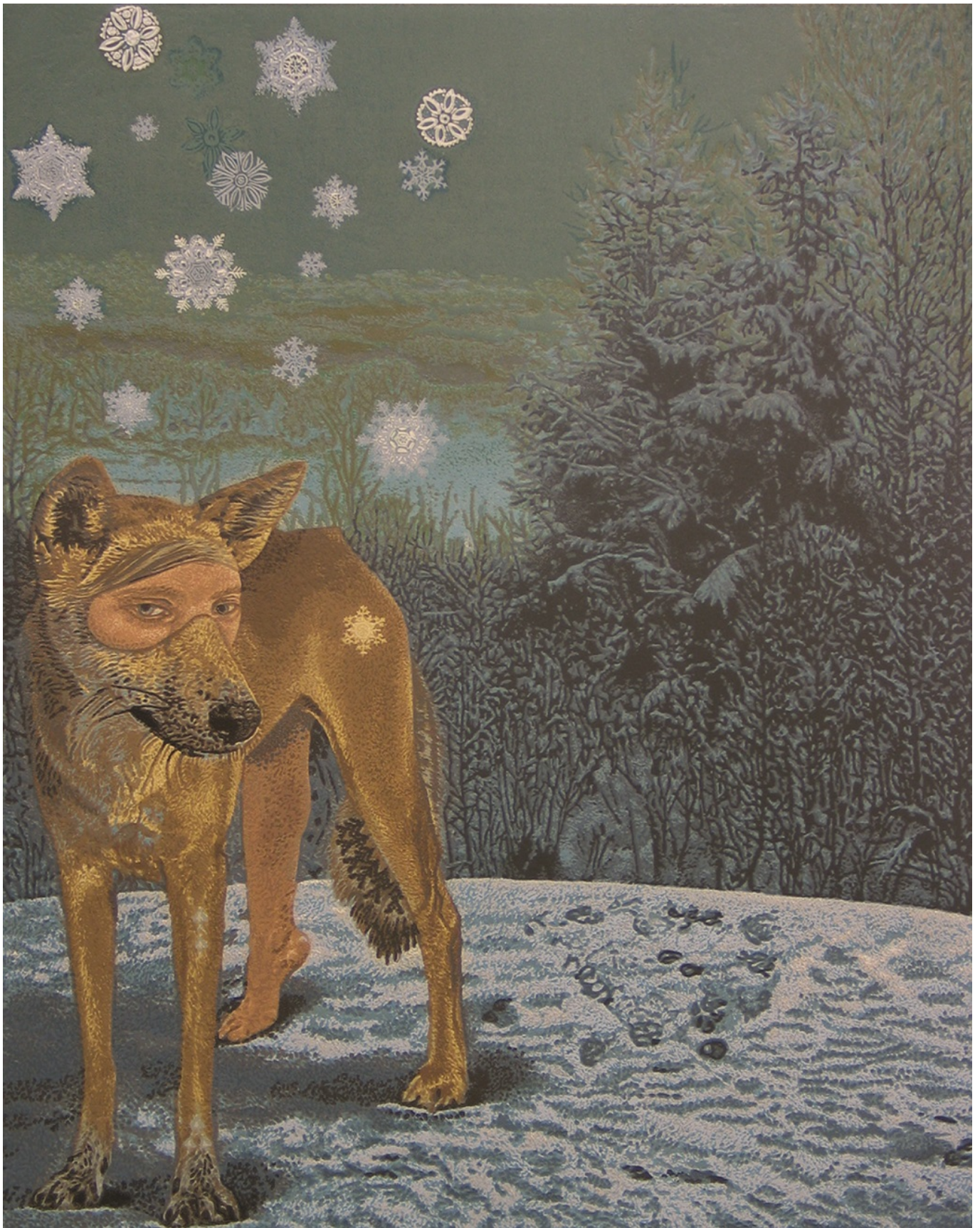
Lapsis, pabėgęs iš zoologijos sodo